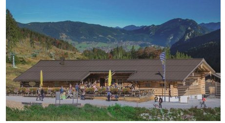
Naturpark Ammergauer Alpen