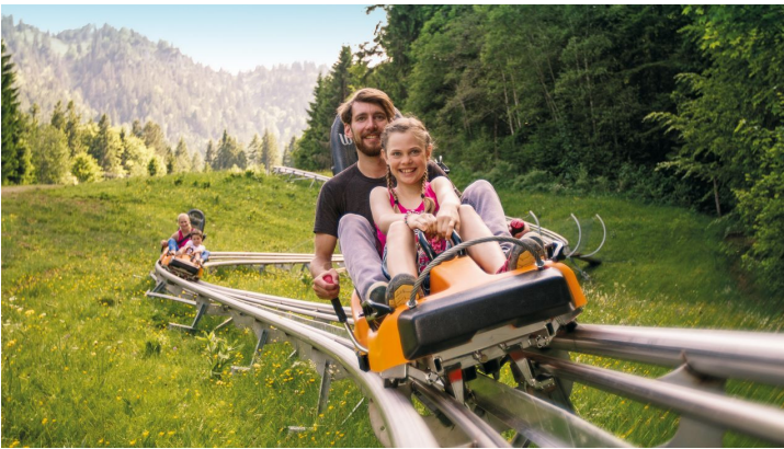
Alpine Coaster AktivArena am Kolben