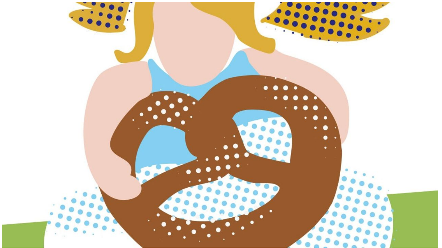
Tourensignet Himmlisch genießen - © Tourismusverband Pfaffenwinkel