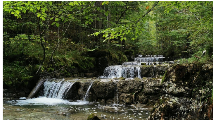
Naturpark Ranger, Naturpark Ammergauer Alpen