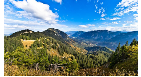
Blick vom Brunnenkopf ins Graswangtal