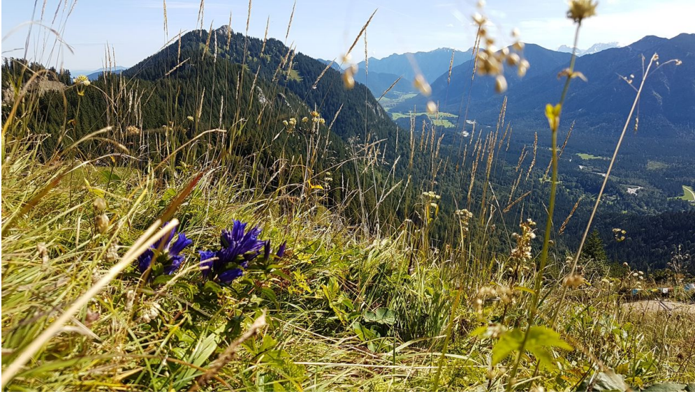
Brunnenkopf mit Blick in Graswangtal