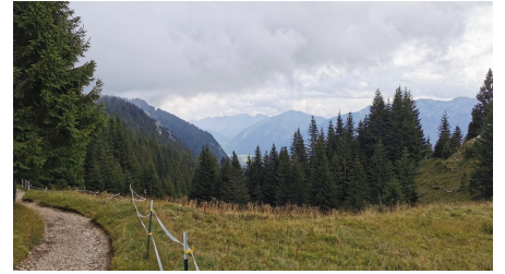
Naturpark Ranger, Naturpark Ammergauer Alpen