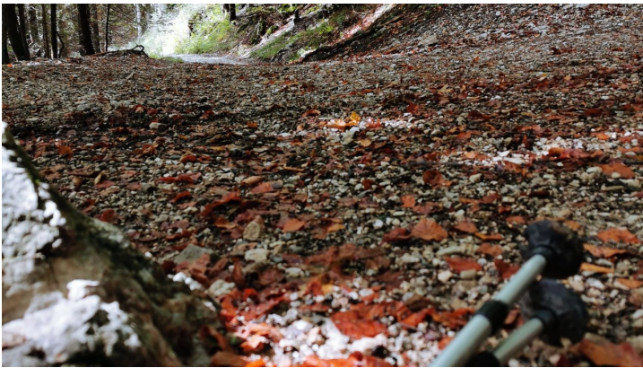
Naturpark Ranger, Naturpark Ammergauer Alpen