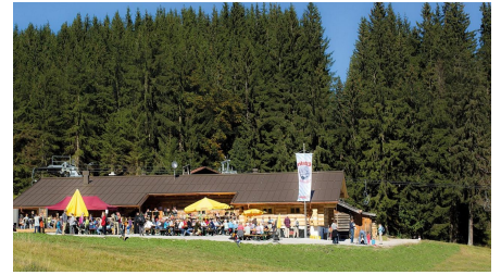
Wanderung - Kolbensattelhütte - Sonnenterrasse