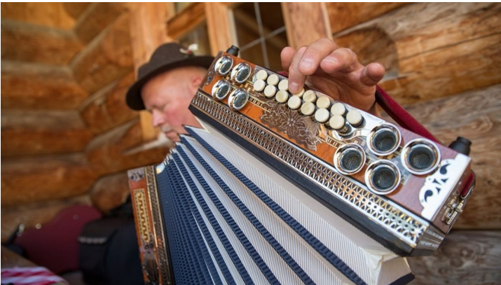
Musikanten auf der Kolbensattelhütte