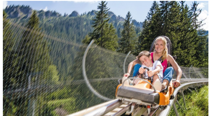
Alpine Coaster am Kolbensattel