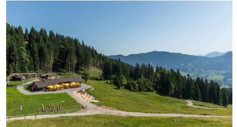
Blick auf die Kolbensattelhütte und Oberammergau - © Mathias Fend, AktivArena am Kolben