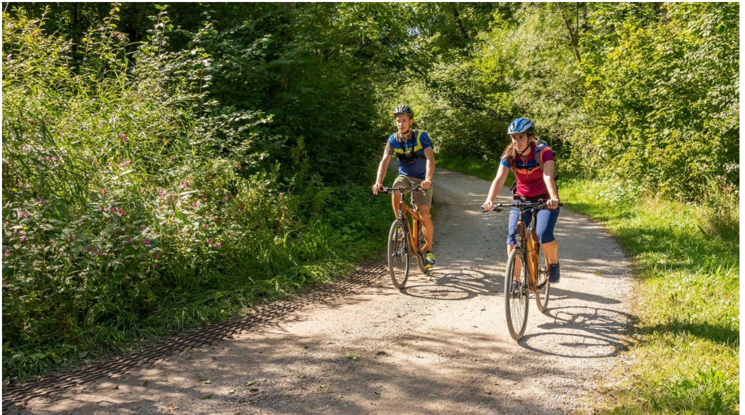
Radeln zwischen Bad Kohlgrub und Benediktbeuern