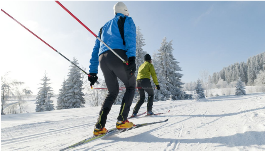
Langlaufloipe Buchwaldrunde