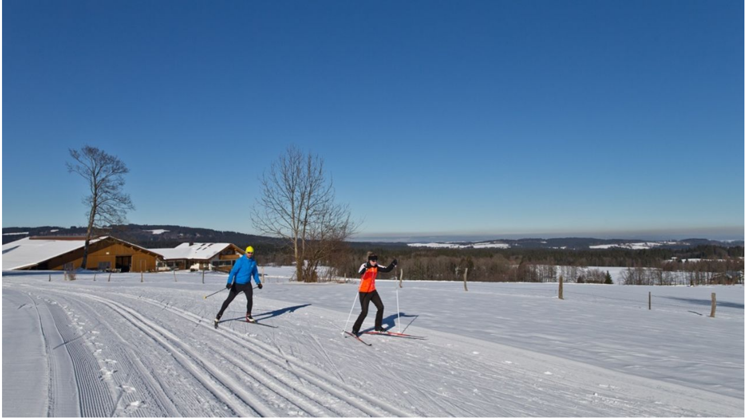
Langlaufloipe - Große Rochusrunde