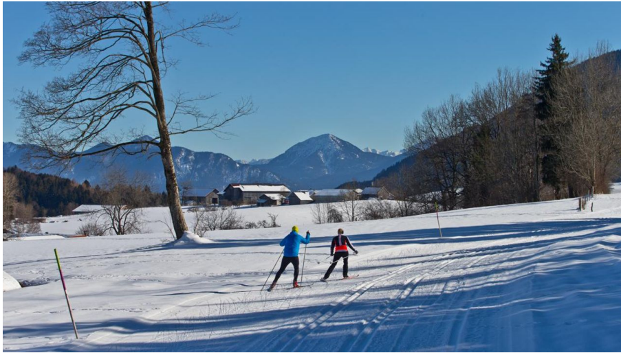
Langlaufloipe - Große Rochusrunde