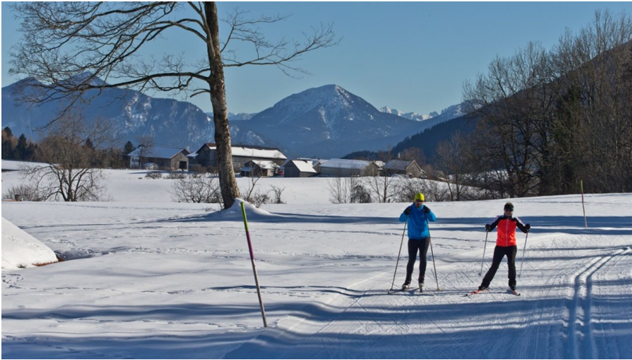
Langlaufloipe Kleine Rochus Runde