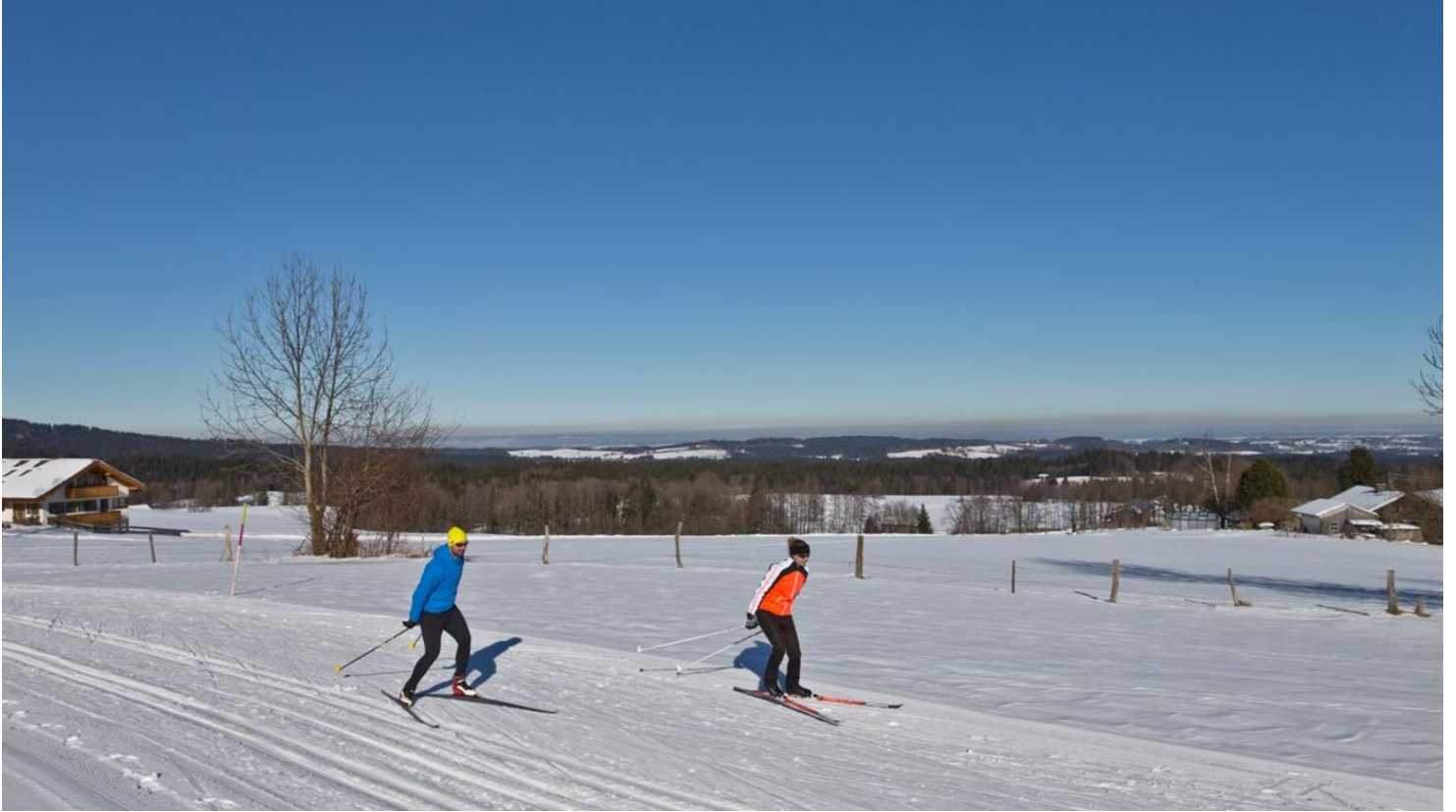
Langlaufloipe Kleine Rochus Runde