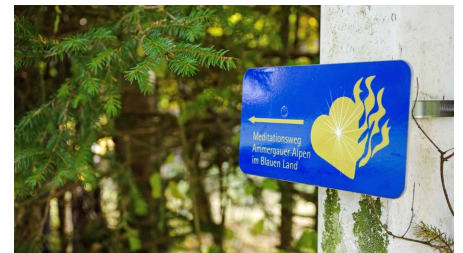
Fernwanderweg Meditationsweg - Auf dem Meditationsweg