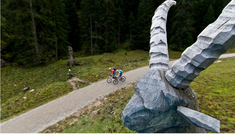
Mountainbiketour - Soila-Alm - © Thorsten Unseld, Anton Brey