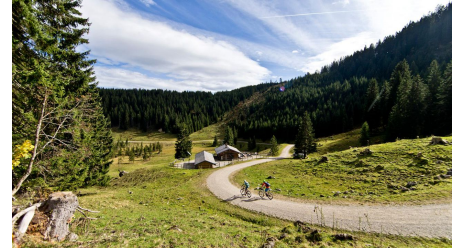
Mountainbiketour - Soila-Alm