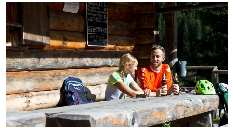
Mountainbiketour - Soila-Alm - Rast an der Alm