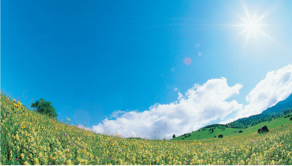
Nordic Walking Rantscher-Weiher-Trail - Blumenwiese bei Bad Bayersoien