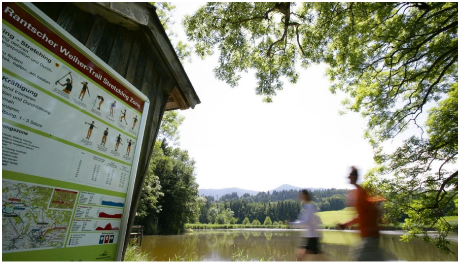
Nordic Walking Rantscher-Weiher-Trail - am Soier See