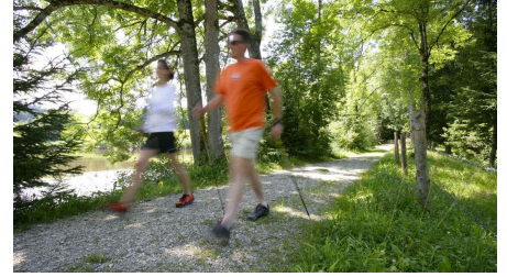
Nordic Walking Rantscher-Weiher-Trail