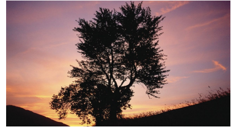
Nordic Walking Rantscher-Weiher-Trail