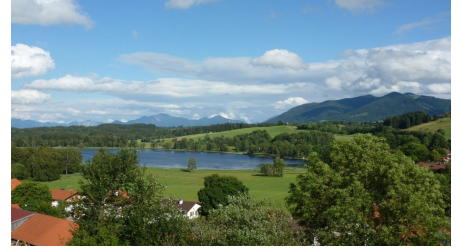
Nordic Walking Soier See Trail - © Thorsten Unsel, Naturpark Ammergauer Alpen