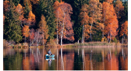
Nordic Walking - Soier-See-Trail