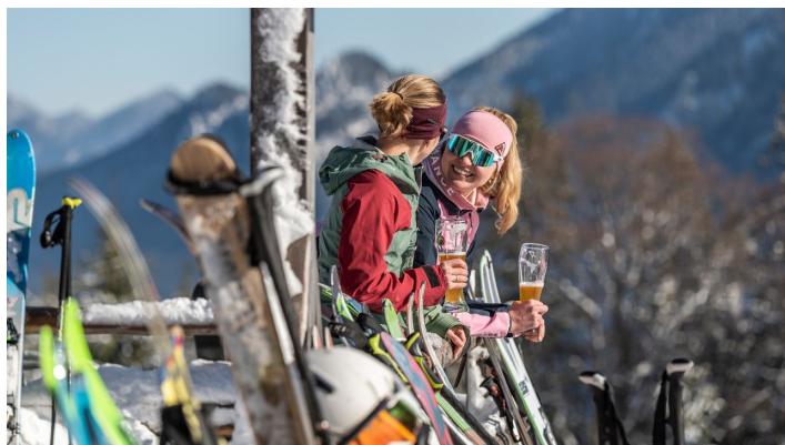
Einkehr an der Kolbensattelhütte - © Simon Bauer, Naturpark Ammergauer Alpen