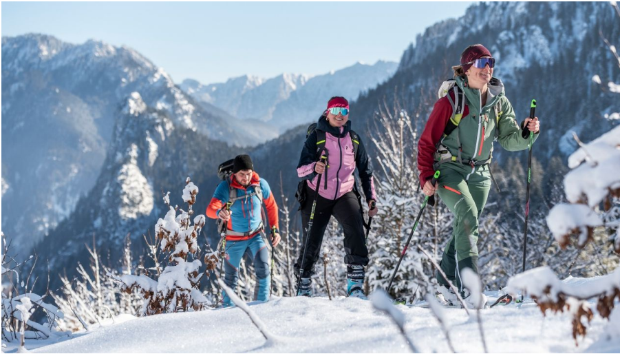
Skitour Kolbensattel