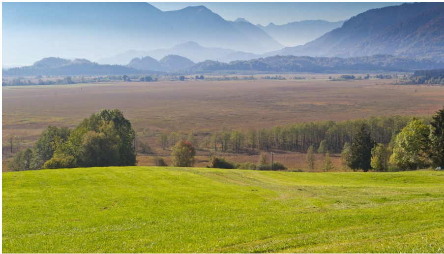
Radtour durchs Murnauer Moos