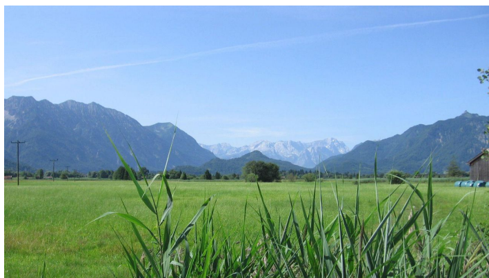
Radtour durchs Murnauer Moos