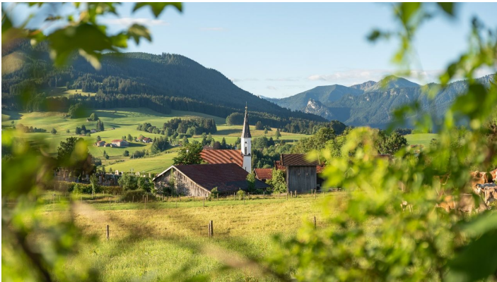
Blick auf Saulgrub im Naturpark Ammergauer Alpen