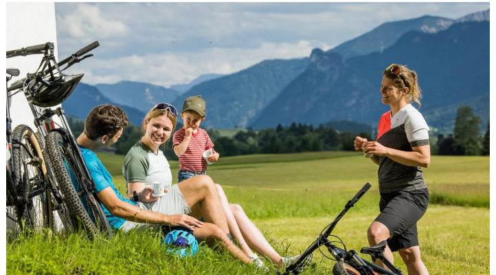
Blick Ammertal