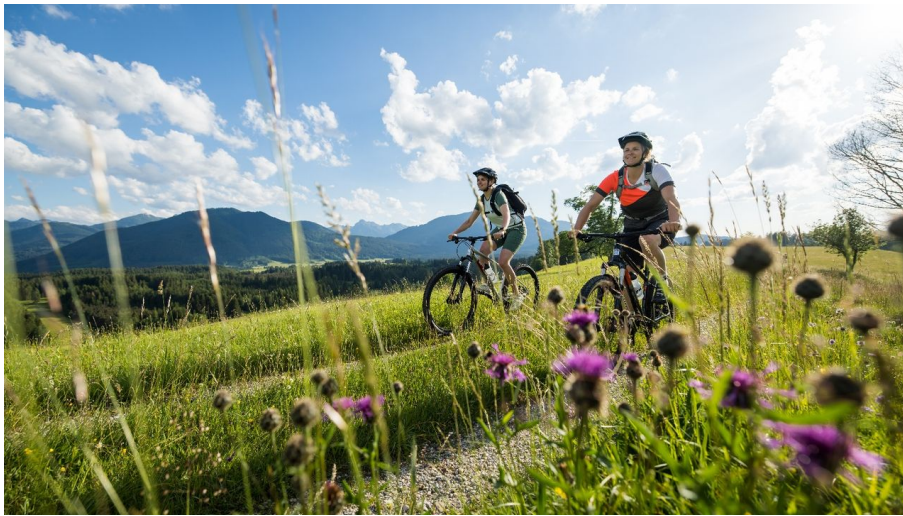
Biken Wetzsteinrücken