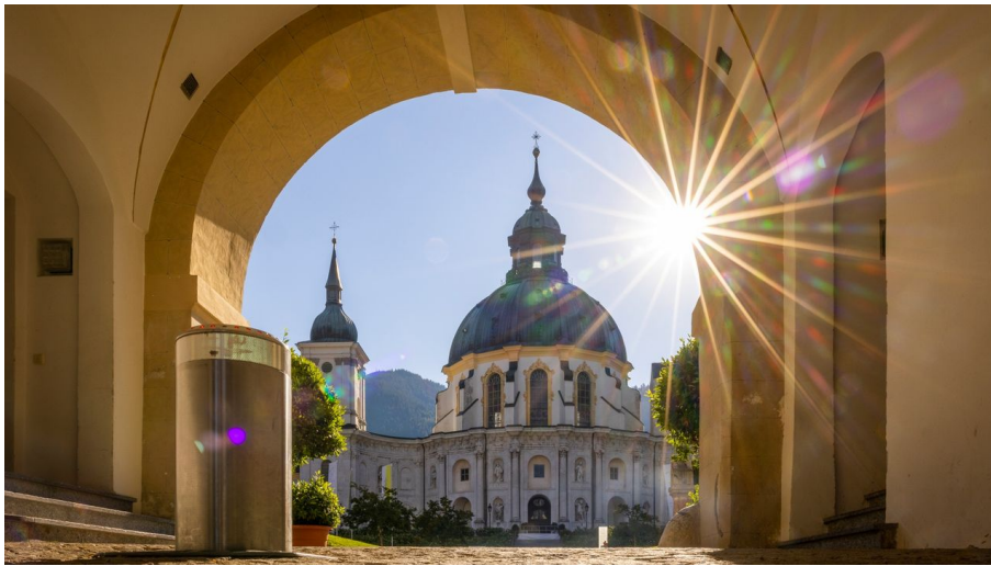
Kloster Ettal