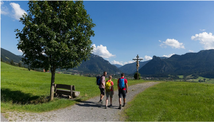
Wanderung - Altherrenweg