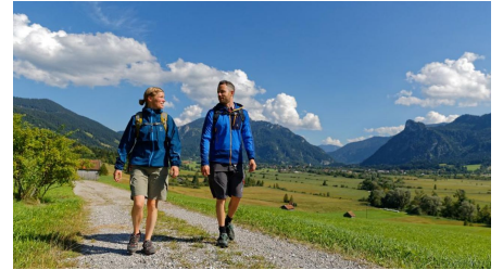
Wanderung - Altherrenweg