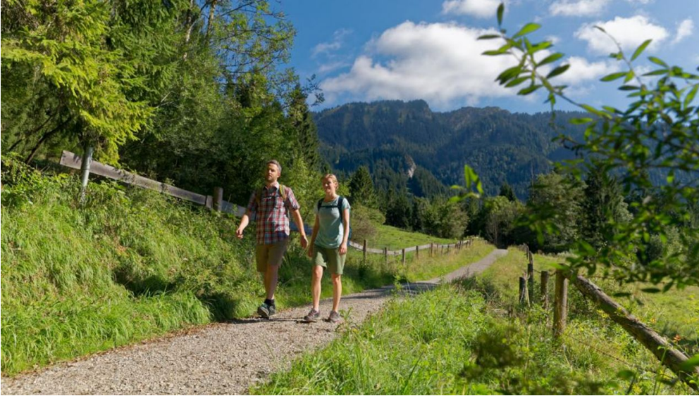
Wanderung - Altherrenweg - © Thorsten Unsel, Anton Brey