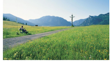
Wanderung Altherrenweg - Bank mit herrlicher Aussicht bei Unterammergau