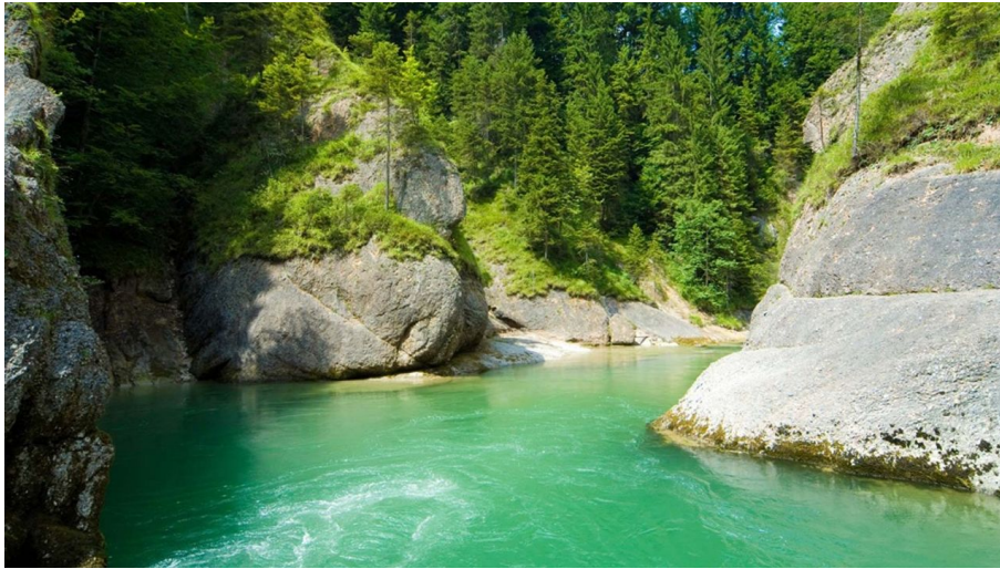
Wanderung - Acheleschwaig - Scheibum - © Thorsten Unsel, Naturpark Ammergauer Alpen