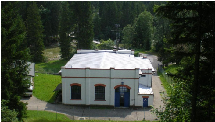
Kraftwerk Kammerl