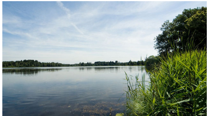
Der Soier See liegt idyllisch eingebettet in den Ammergauer Alpen