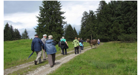
Wanderung - Haselbachweg