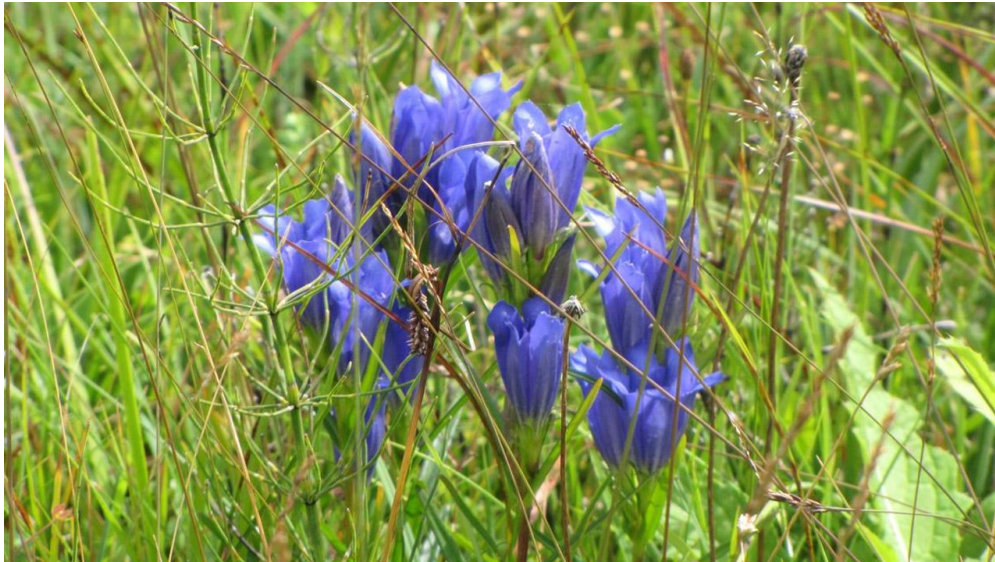
Wanderung - Haselbachweg - Lungenezian am Wegesrand