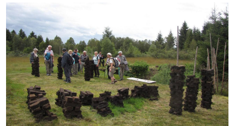
Wanderung - Haselbachweg