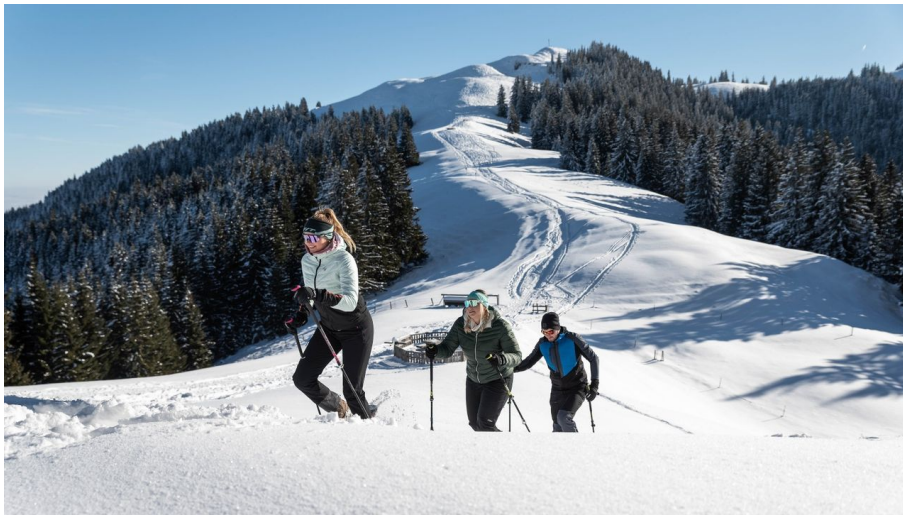
Schneeschuhwandern Hörnle Bad Kohlgrub