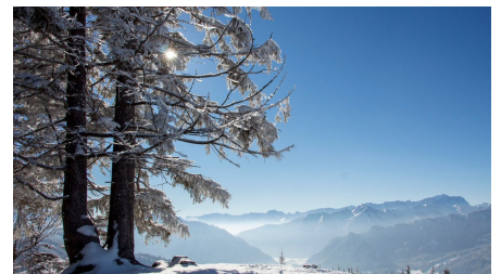
Hörnle im Februar