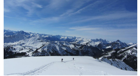
Skitour Hochblasse - kurz vor dem Gipfel