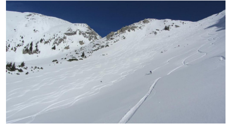
Skitour Hochblasse - Abfahrt - © Thorsten Unseld, Thorsten Unseld