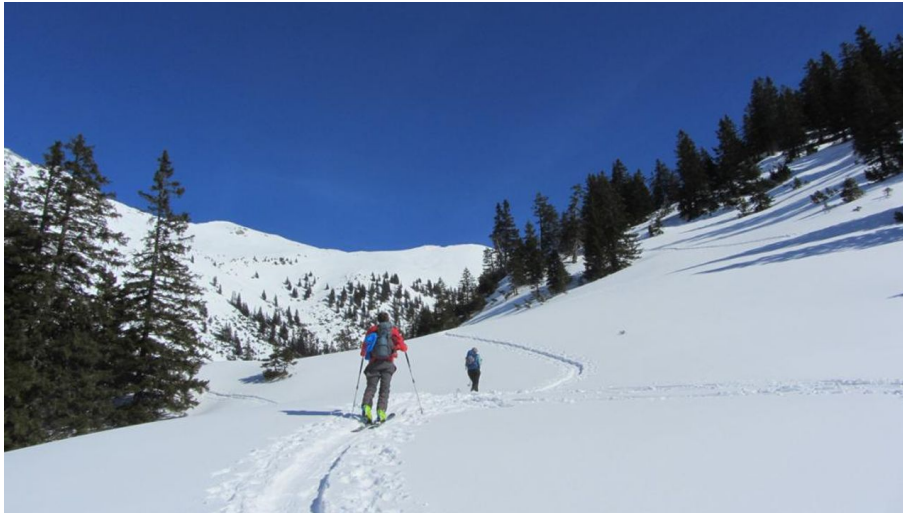
Skitour Hochblasse - Aufstieg