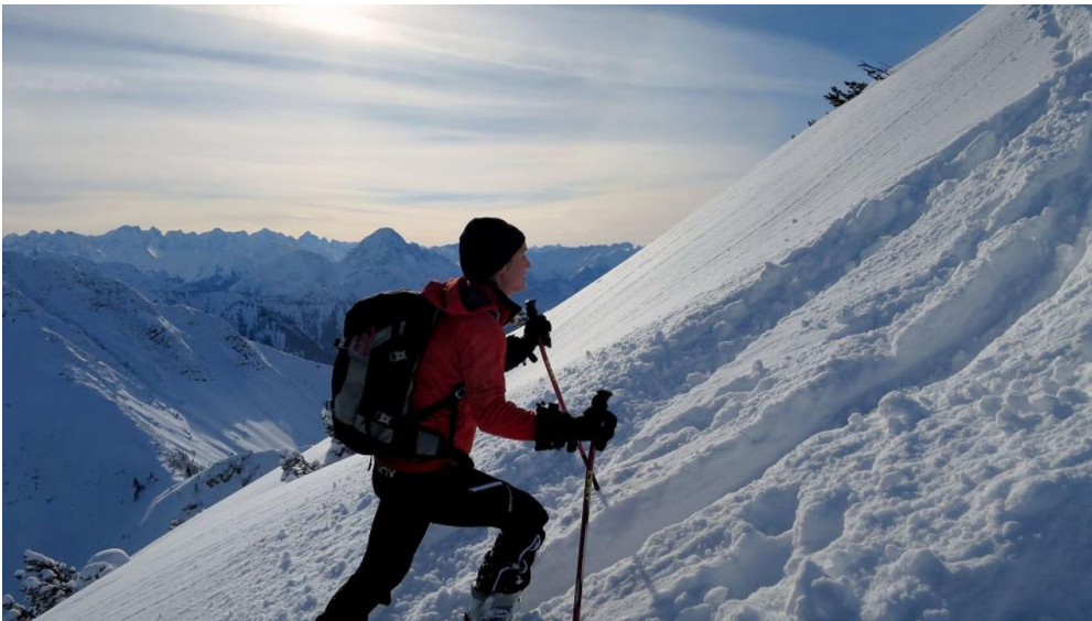
Skitour - Ochsenälpleskopf