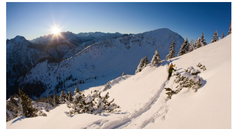
Skitour Ochsenälpleskopf