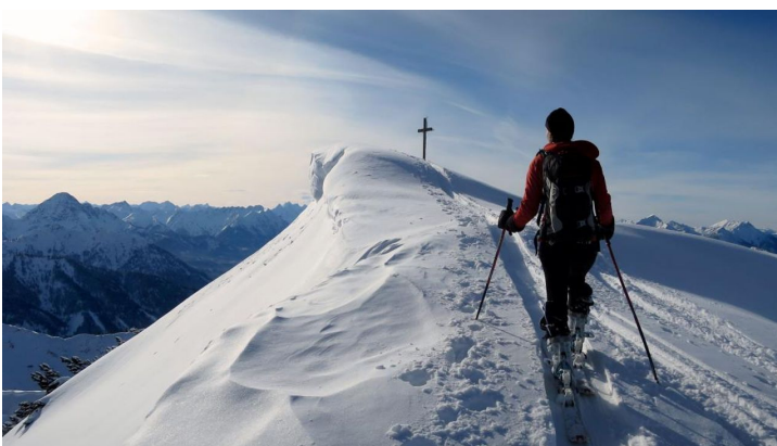
Skitour - Ochsenälpleskopf