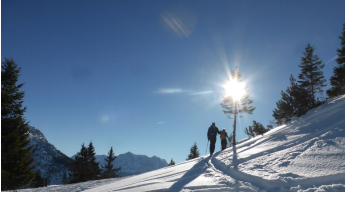
Aufstieg Ochenälpleskopf