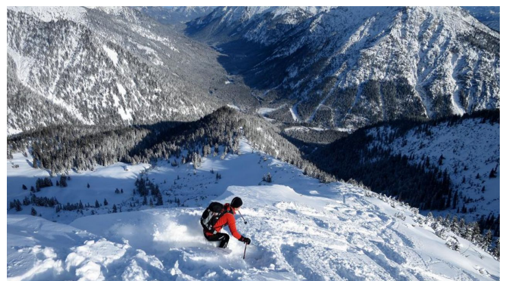
Skitour - Ochsenälpleskopf