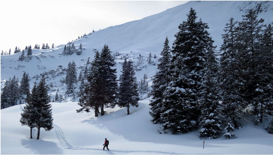
Aufstieg Ochsenälpleskopf