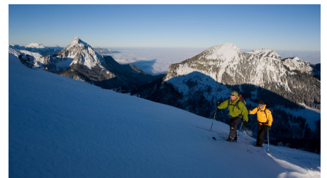
Skitour Ochsenälpleskopf