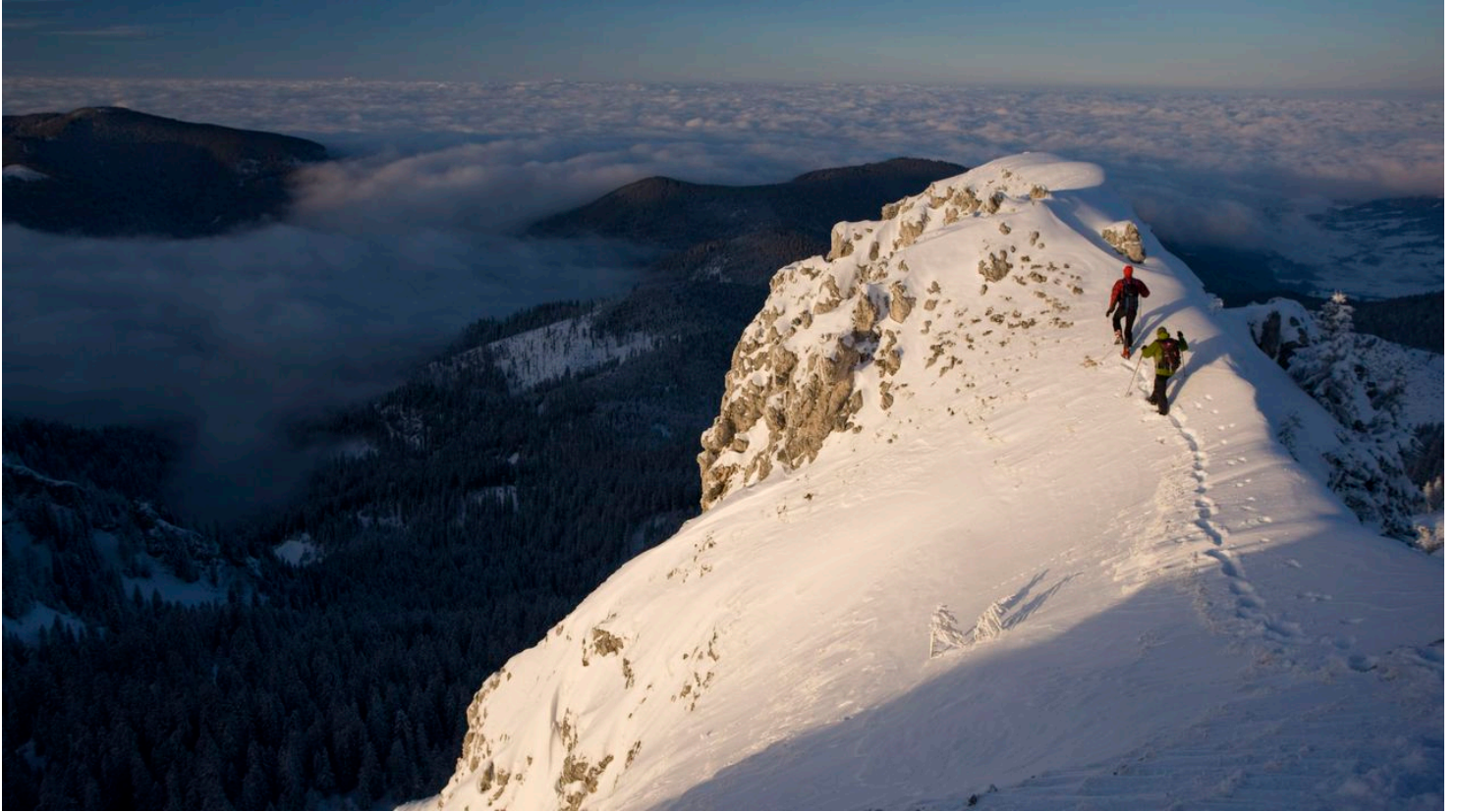
Skitour Teufelstättkopf