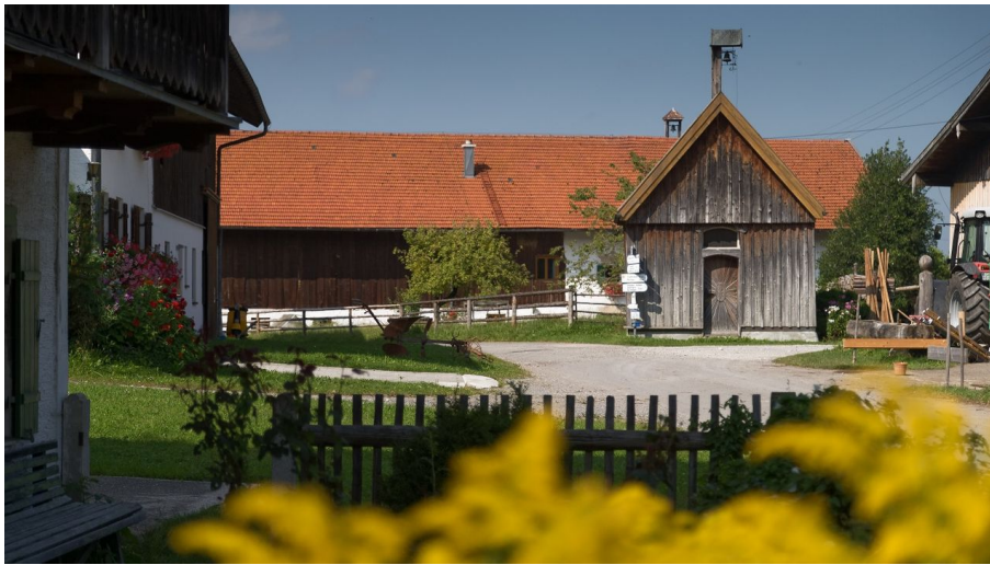
Sprittelsberg - © Anton Brey, Ammergauer Alpen GmbH