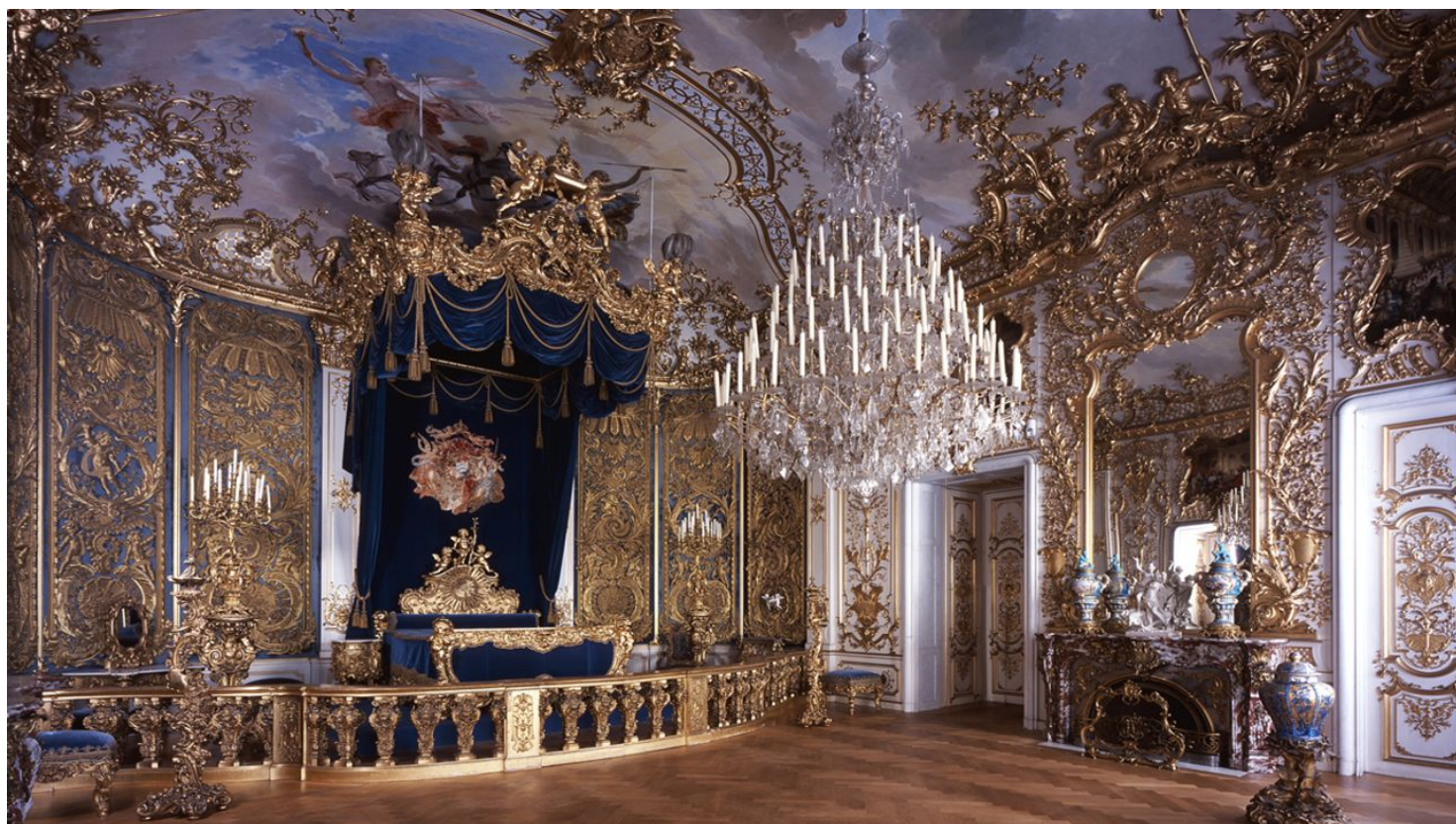
Wanderung durchs Graswangtal zum Königsschloss - Schlafzimmer König Ludwig II.