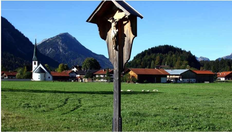
Wanderung durchs Graswangtal zum Königsschloss - Blick auf Graswang