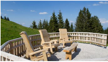
Wanderung Zeitberg - Ruhesessel