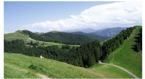
Fernwanderweg Meditationsweg Ammergauer Alpen - am Hörnle