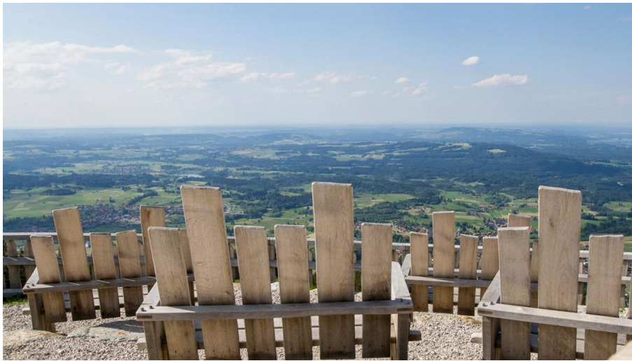
Wanderung Zeitberg - Zeitberggipfel mit 3D Kino