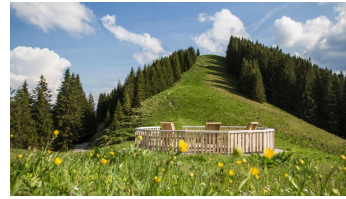
Mittleres Hörnle - © Thorsten Unsel, Matthias Fend