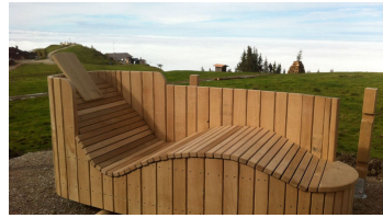
Zeitberg Moorliege zum Entspannen