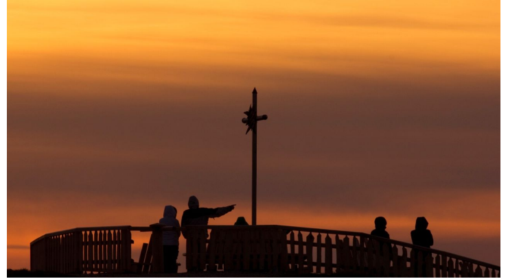
Wanderung Zeitberg - Zeitberggipfel im Sonnenuntergang - © Thorsten Unsel, Naturpark Ammergauer Alpen