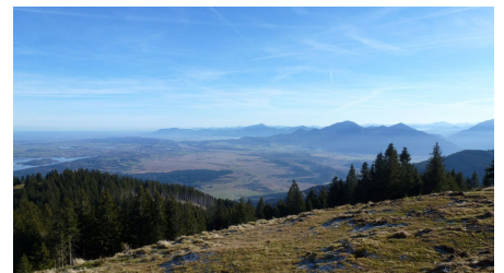
Fernwanderweg Meditationsweg Ammergauer Alpen - am Hörnle