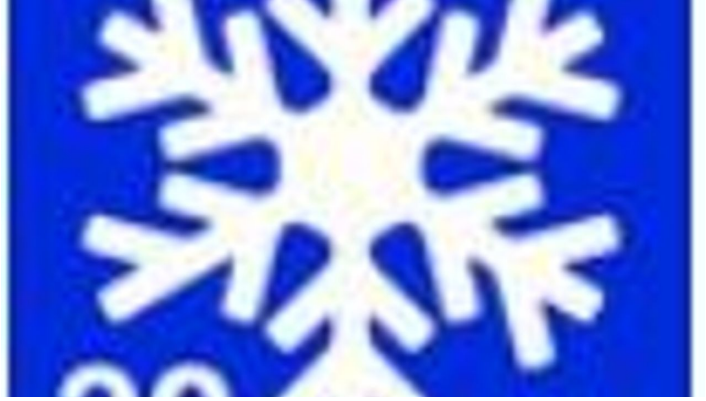
Winterwanderweg 20 Gschwendt Runde