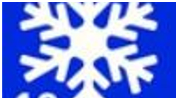
Winterwanderweg 12 Rantscher Weiher