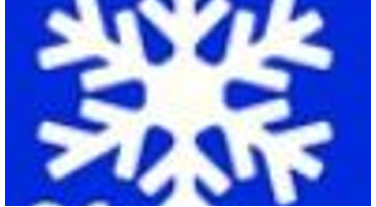
Winterwanderweg 1 Sonnenweg