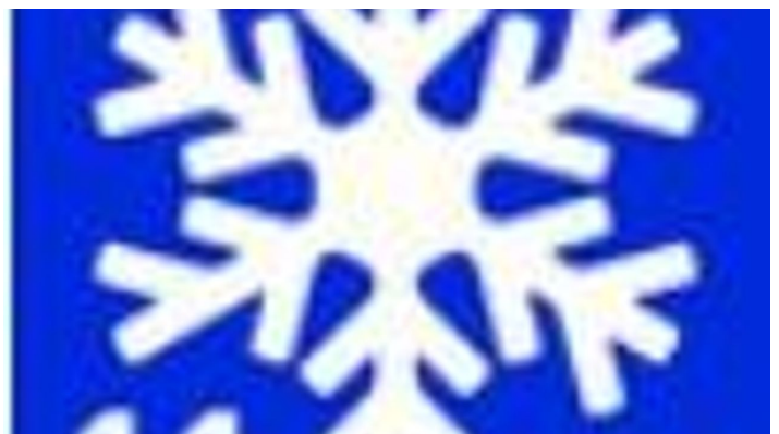
Winterwanderweg 11 Wiesmahd