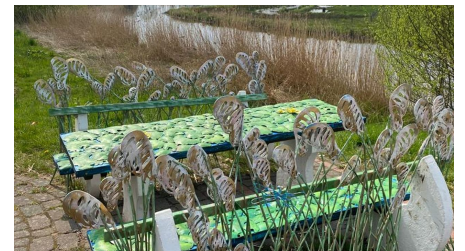
Lieblingsort alte Staaßen Brücke