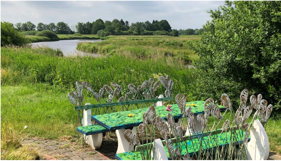
Lieblingsort Alte Staaßenbrücke