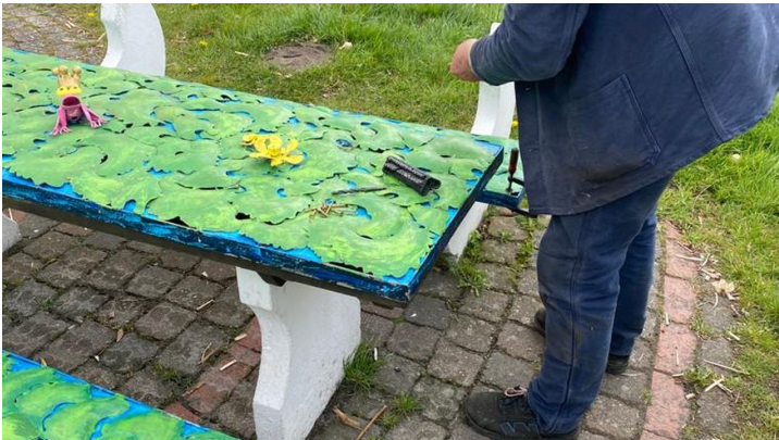
Aufbau der Schilfbank