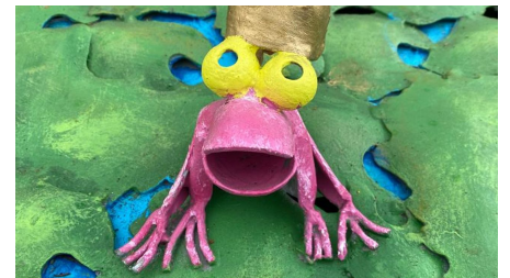
Frosch im Lieblingsort