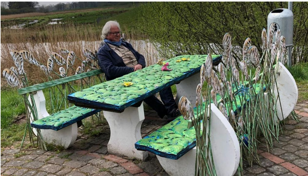
Lieblingsort Alte Staaßenbrücke-Schilfbank