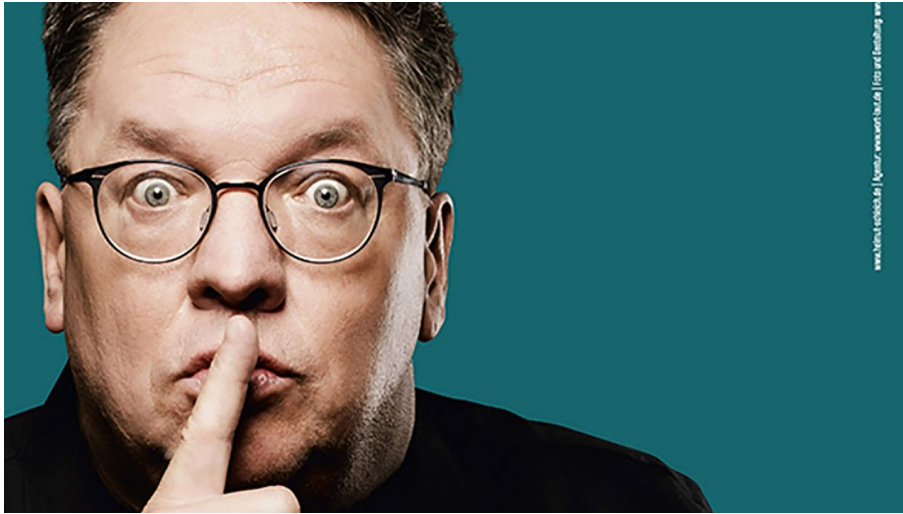
Abo-Helmut-Schleich-by-susie-knoll.jpg - © by Susie Knoll