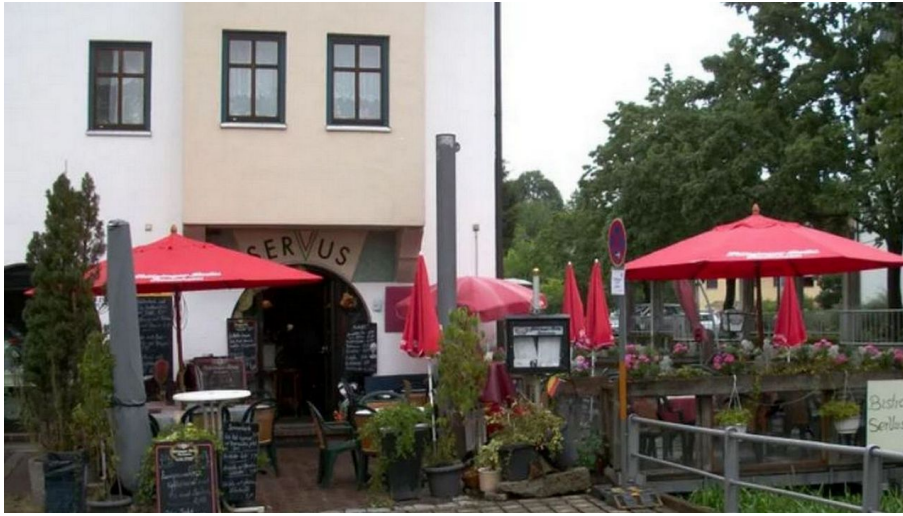
Bistro-Café Servus