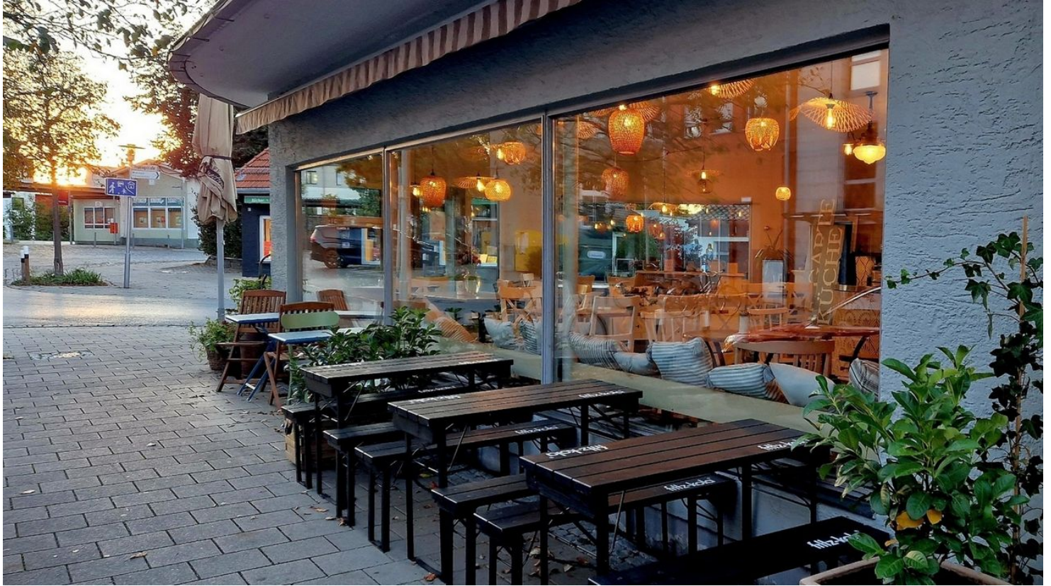
Die Gartenküche in Bad Aibling