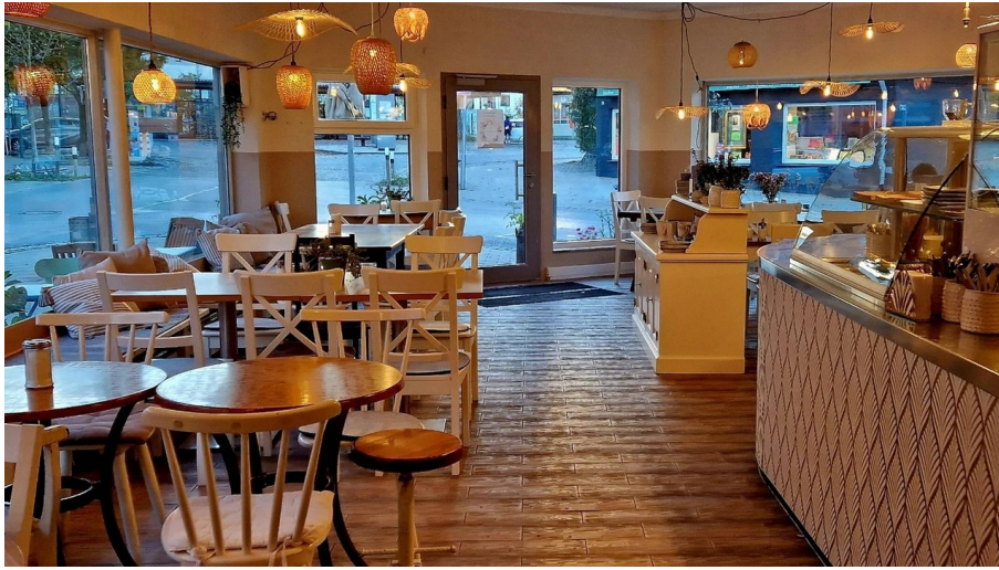
Die Gartenküche in Bad Aibling