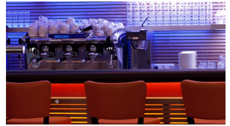
Grassinger Café & Restaurant