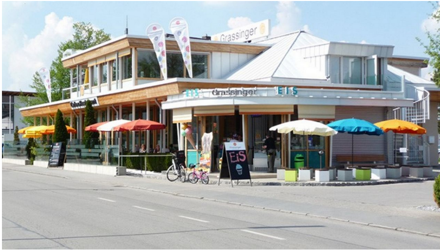
Grassinger Café & Restaurant