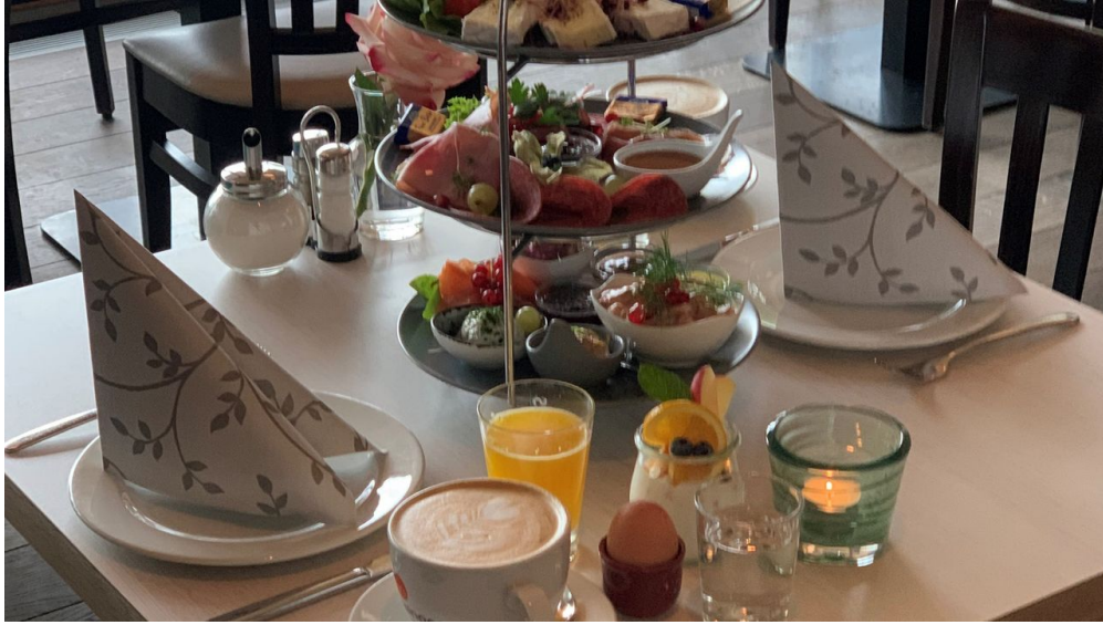
Grassinger Café & Restaurant