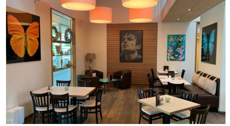
Grassinger Café & Restaurant