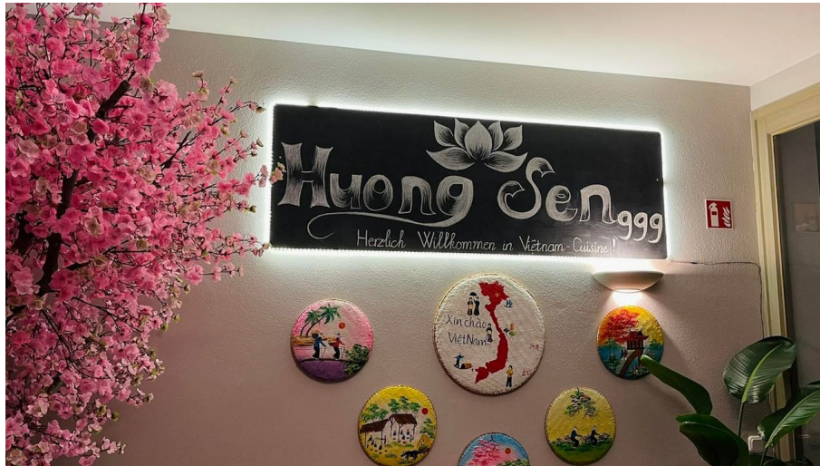
Huong Sen 999