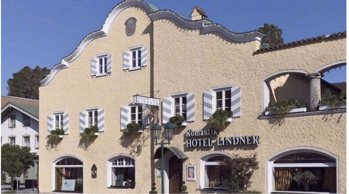
Das Lindner Bad Aibling