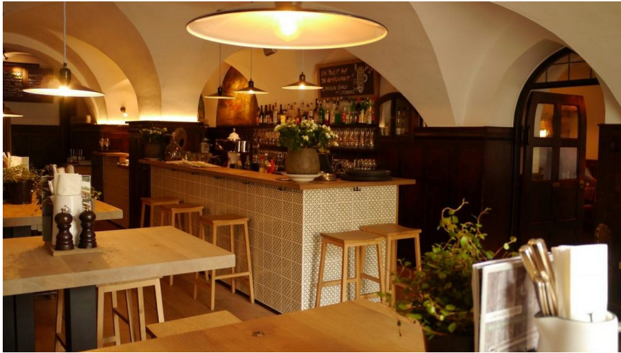
Das Lindners Bad Aibling