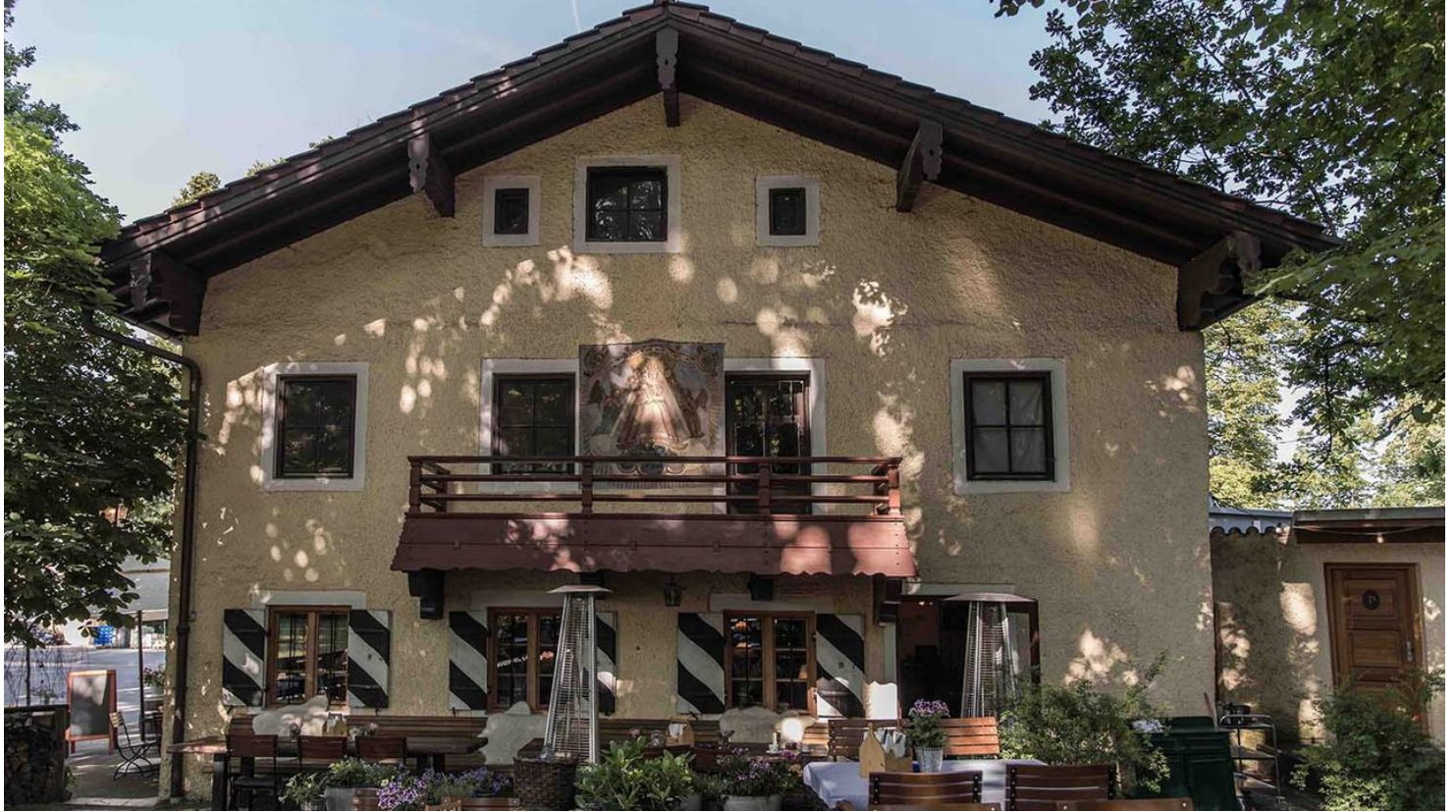
Schlosswirtschaft Maxrain Biergarten