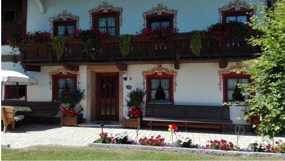
Vorm Haus - © Rottmueller