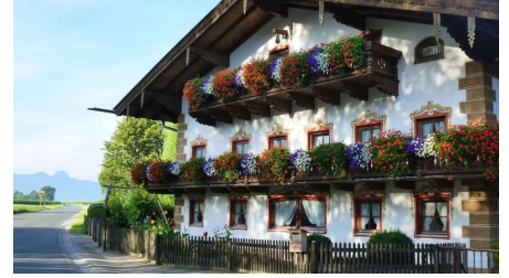
Hausansicht - © Rottmueller