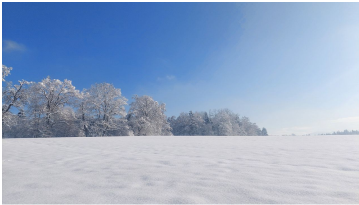
Thalacker im Winter