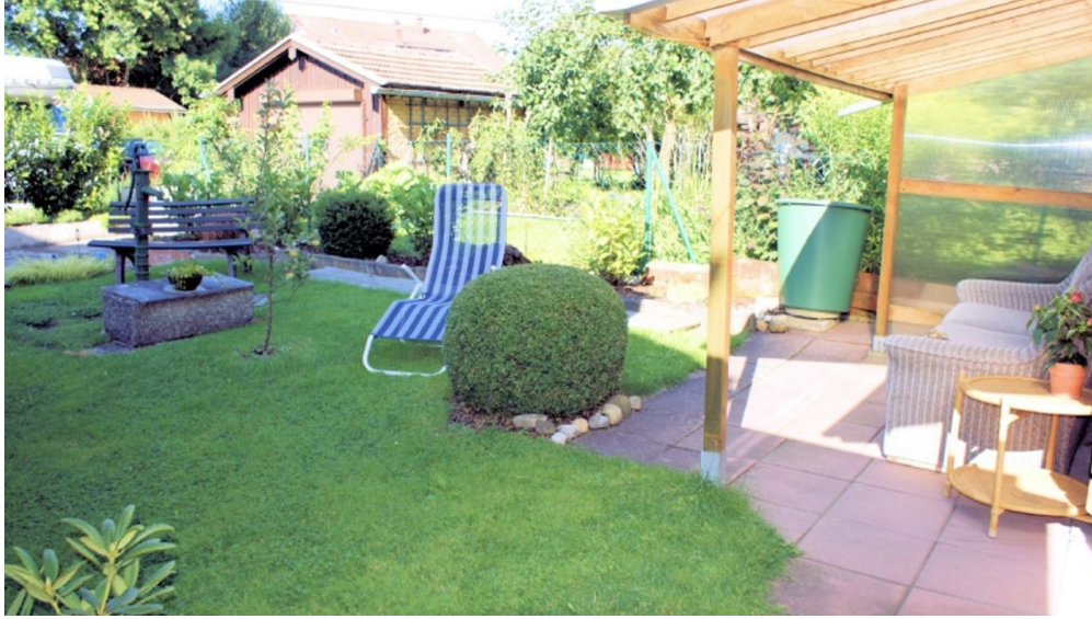
Garten - © Bradaric-Williams