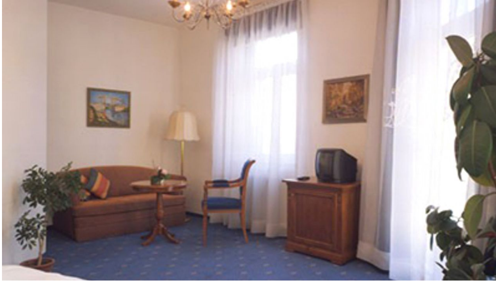
Zimmerbeispiel - © Hotel Johannisbad