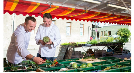
gekocht wird mit frischen Zutaten