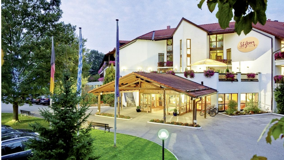
Hausansicht Sommer