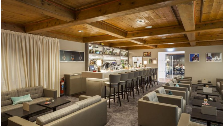
Bar - © Hotel St. Georg