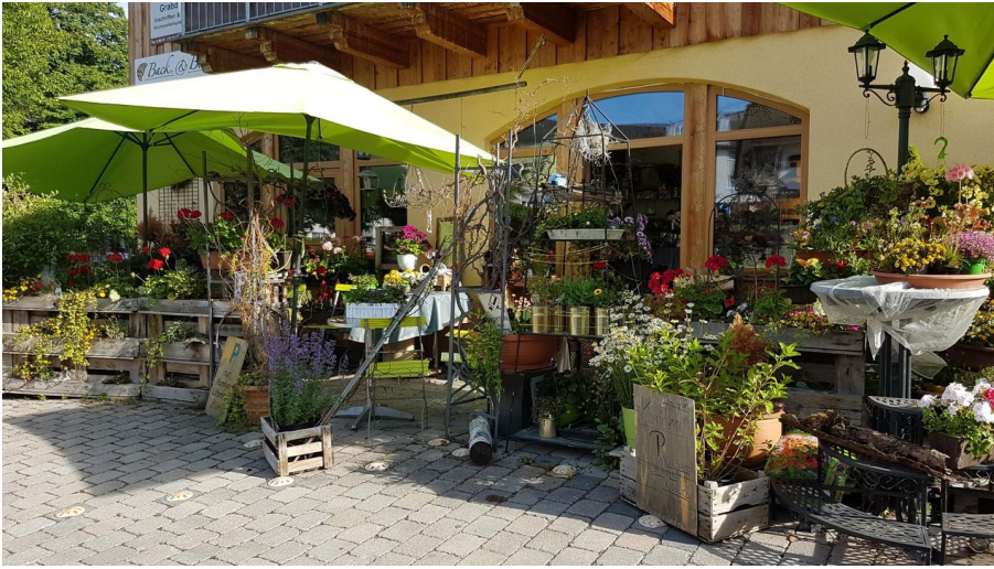
Backen & Blumen