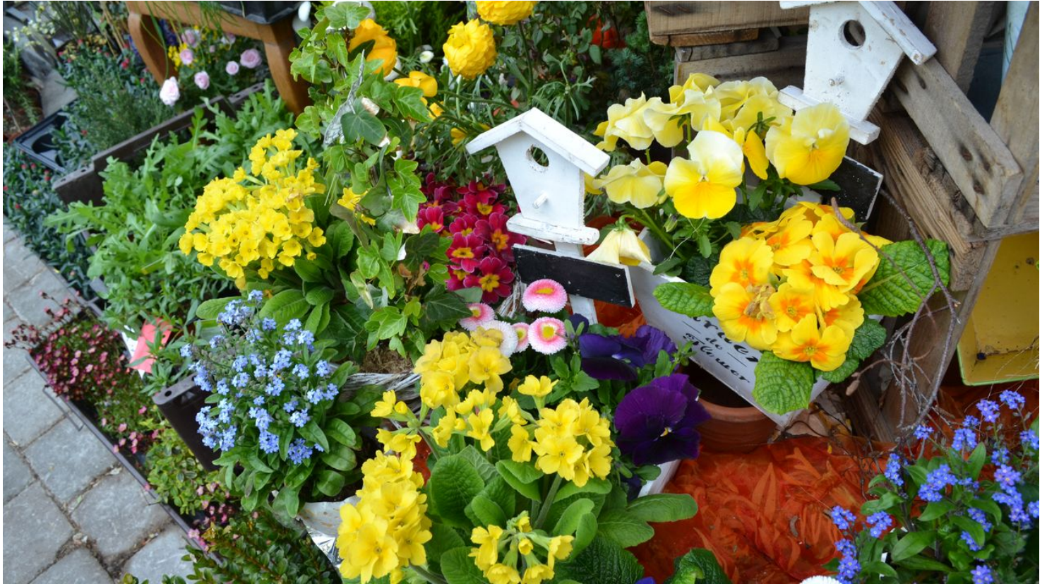
Backen und Blumen