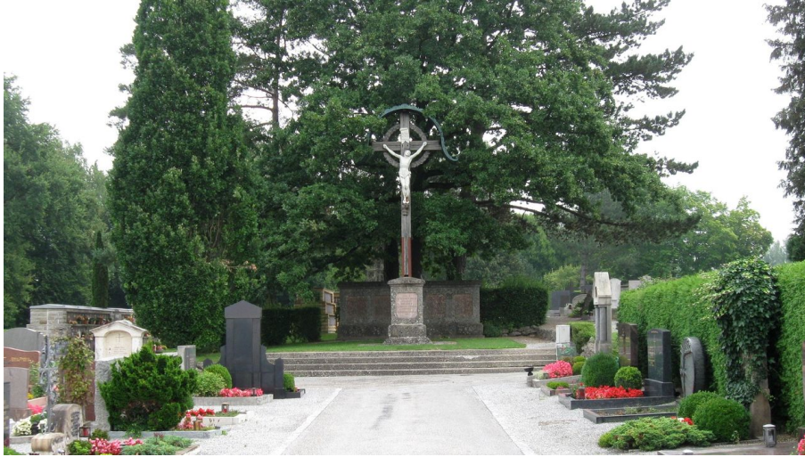
Das Große Kreuz