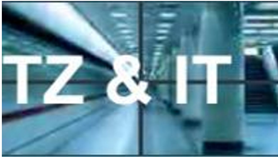
Datenschutz & IT Becker