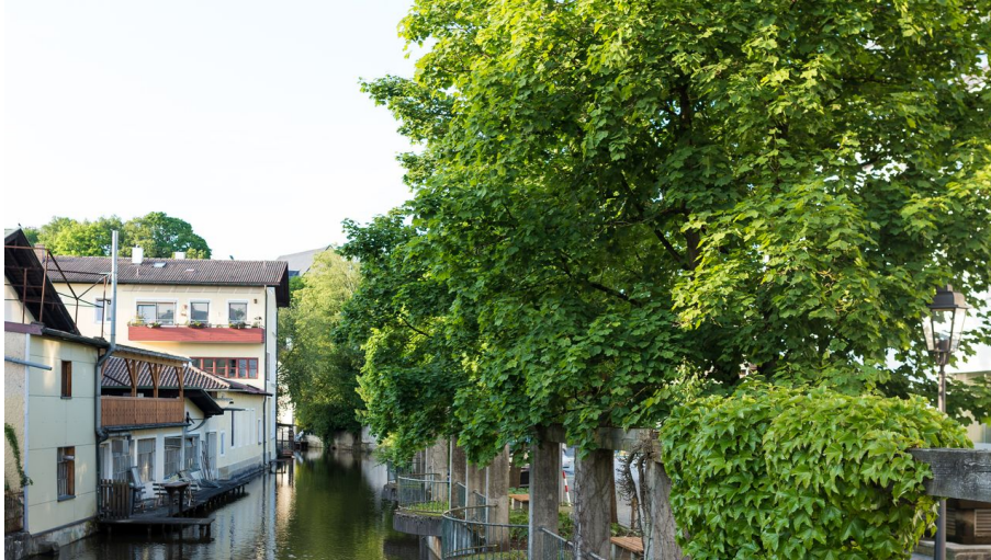
Brücke über den Mühlbach