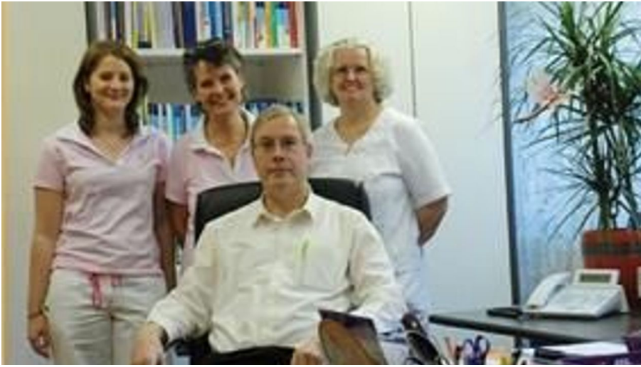
Dr. Hellmund und Team