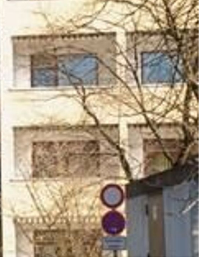
Praxis Dr. Hellmund