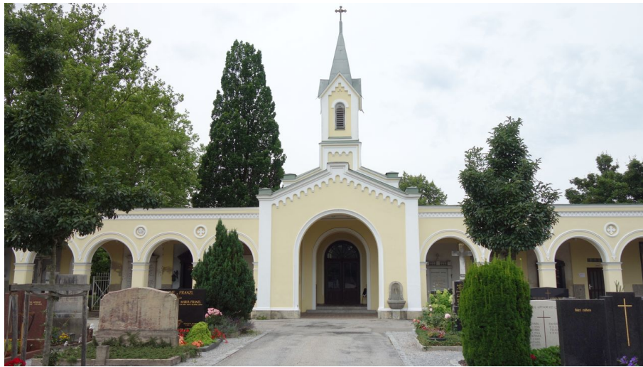
Friedhof Bad Aibling