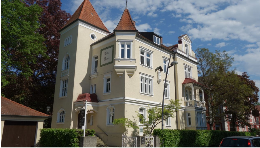
Galerie Villa Maria