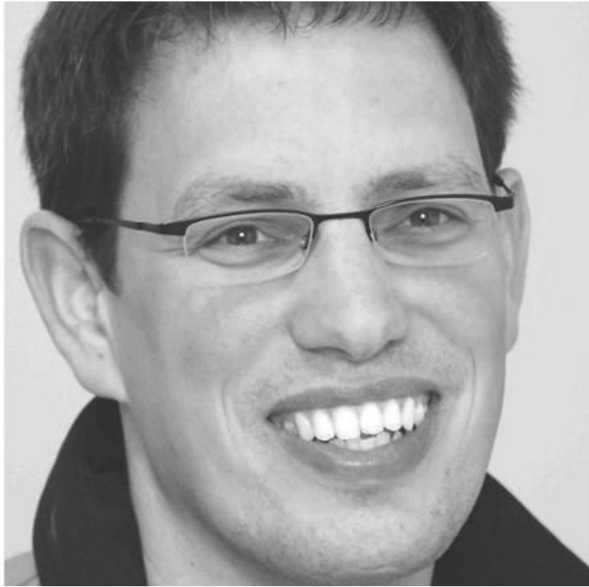
Christian Becker - © Christian Becker